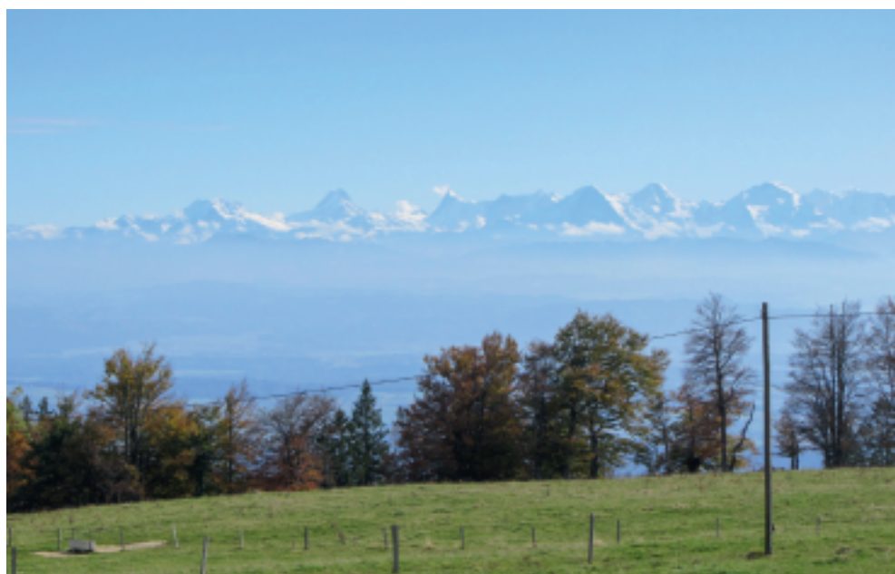
Vue sur les Alpes.

De la Werdtberg, nous prenons la direction de la Cabane de la Rochette. Le panneau jaune indique une heure de marche. À la Métairie de Malleray où un troupeau de vaches Angus pâit, nous poursuivons par le chemin des Marguerites, toujours en direction de la cabane de la Rochette, propriété de la section prévôtoise du CAS. Arrivés à celle-ci, nous avons la possibilité de nous y ravitailler le week-end puisqu'un gardiennage y est organisé