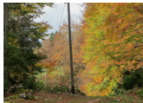
La magie de l'automne sur le Montoz.

Les Alpes, à notre droite, sont toujours majestueuses et c'est avec surprise que nous découvrons une forêt de sapins qui nous rappellent les Franches-Montagnes puis de nombreux frênes. À la Bergerie de Bévilard, nous mettons le cap sur Péry via la Bergerie du Pré la Patte. Le panneau indicateur mentionne 35 minutes. D'ici, nous entamons une légère descente dans un magnifique et sauvage paysage boisé. Nous traversons le Pré Ménori où se situe une ancienne ferme transformée en résidence secondaire. L'endroit est magique, la forêt est composée de diverses espèces et essences. À cette époque de l'année et à cette altitude, colchiques et gentianes croissent en abondance. Les Alpes paraissent de plus en plus