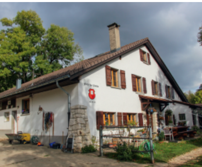
Métairie du Pré la Patte.