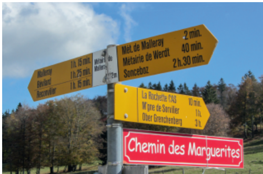
Par le chemin des Marguerites.