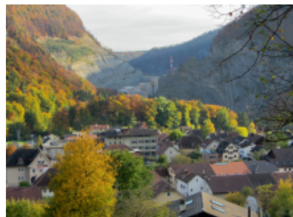
Péry et sa cimenterie.